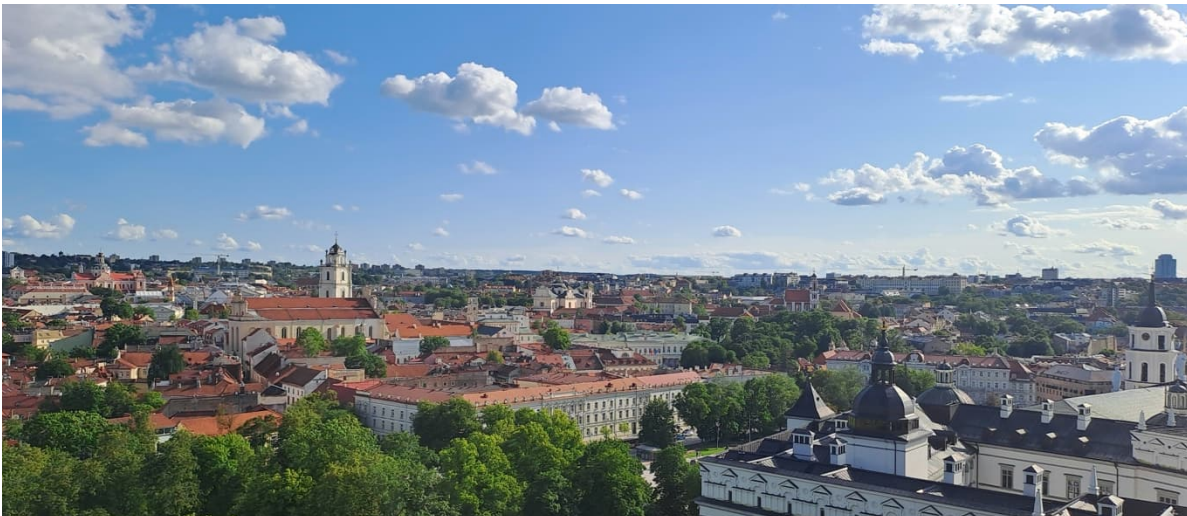
Ausblick auf die Stadt des Gediminas-Turms

Gefängnis teil. Von der Führung wurde im Nachhinein sehr gut berichtet, sie kostete jedoch auch sage und schreibe 20 Euro. Wenn man die Zeit findet, empfehlen sich auch Tagestrips zum See nach Trakai oder in die Stadt Kaunas. Außerdem sollte man Badesachen einpacken, für den Fall, dass das Wetter mitspielt und man gerne schwimmen geht. Wir kamen leider im Regen an. Erst zum Ende unseres Aufenthalts wurde es schön, jedoch hatten wir - bis auf eine Person - keine Schwimmsachen dabei, sodass wir in dieser Hinsicht leider leer ausgingen. Die Restaurants und Bars in Vilnius sind vergleichsweise günstig und es gibt viele süßen Cafés zu entdecken. Natürlich profitierten wir am Wochenende auch vom Nachtleben in Vilnius und tanzten gemeinsam, bis der Club seine Türen schloss.