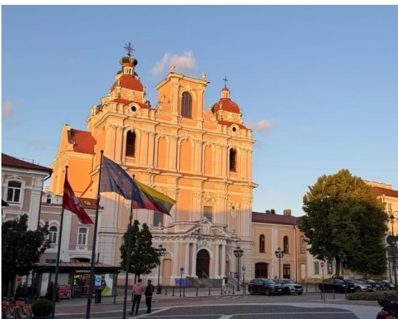
Kasimir - Kirche

Vilnius ist eine der grünsten Städte Europas. Das merkt man nicht nur beim Spazieren am Fluss, sondern spätestens, wenn man sich von einem der Aussichtspunkte einen Überblick über die Stadt verschafft. Am zweiten Tag waren wir alle zusammen bei Gediminas-Turm und begeistert von der schönen Aussicht. Angeblich soll auch der Berg mit den drei Kreuzen eine schöne Aussicht bieten. In Vilnius gibt es auch ein kleines Bernsteinmuseum, das sich lohnt zu besuchen und das ein oder andere Souvenir zu kaufen. Einige von unserer Gruppe nahmen am Sonntagabend zudem an einer Führung durch das Lukiškės-